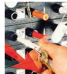
K-pin med nøglen kan fjernes fra pinslot UD