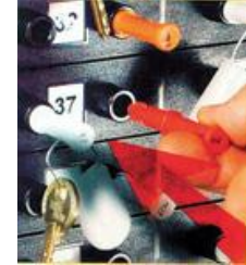
Den personlige A-pin sættes i pinslot IND

De personer der skal kunne fjerne nøgler, nøglebundter eller lignende får udleveret én eller flere personlige A-pin (Access pin), der anvendes til at fjerne nøgler fra nøgletavlen. A-pin leveres i 22 standardfarver og er nummererede. K-pin (Key pin) fastgøres til de nøgler, nøglebundter eller lignende, der skal sikres med en forsegling/plombe, som vi kalder KeyPlomb. K-pin er nummeret med matchende numre som nøgletavlen. Dermed er placeringen entydig.