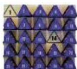
AutoBlock med tilhørende væghængt oversigtstavle

Vi leverer også AutoTag skilte med matchende numre og farver, der lægges i køretøjets forrude eller hænges i bagspejlet. Alternativt leverer vi også magnetiske AutoBlock, der kan sættes på køretøjernes tag for endnu større synlighed.