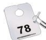
Autotag skilt med matchende K-pin og Keyplomb